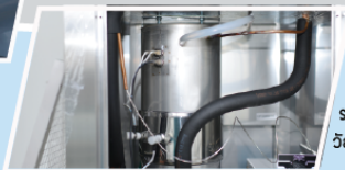
ถังบรรจุน้ำร้อน เชื่อมด้วยท่อสแตนเลส ผ่านการตรวจสอบโรสารณะทั่ว โดยกรมวิทยาศาสตร์บริการ ระบบทางเดินของกระป๋องน้ำเป็นสายยางซิลิโคน วัสดุไม่เป็นอันตราย ใช้กับน้ำและอาหาร Food Grade