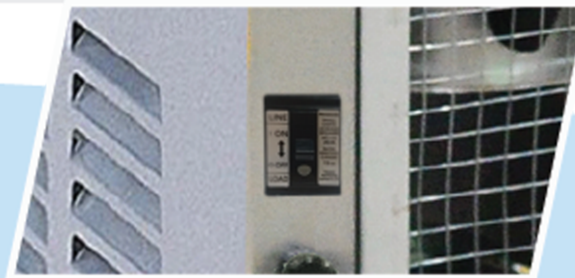
สวิตช์ตัดไฟอัตโนมัติ "เบรกเกอร์" ป้องกันไฟดูด ได้รับมาตรฐาน มอก.