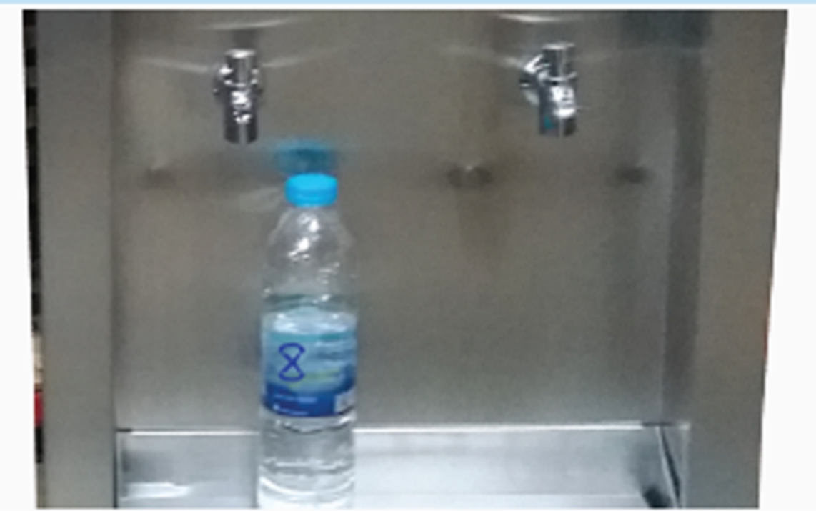
รองรับขวดน้ำ ความสูง 25 ซม. หรือ 600 ML สะดวก ใช้งานง่าย

ชุดคอนเดนเซอร์ คุณภาพมาตรฐาน ทนทานต่อการใช้งาน เป็นเลิศในการทำน้ำเย็น