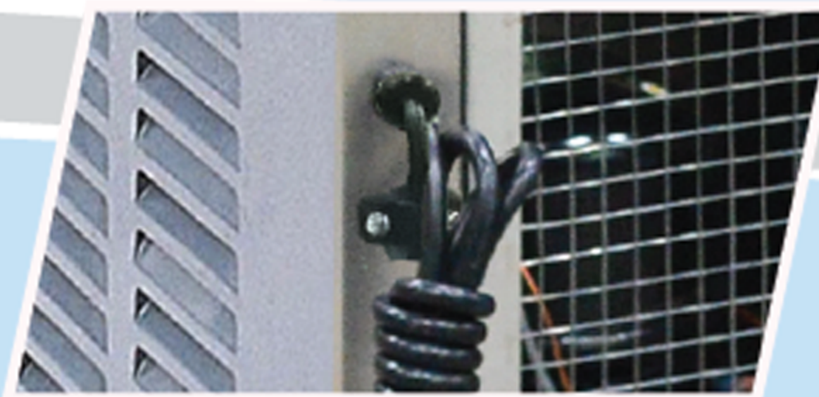
สายไฟพร้อมปลั๊ก 3 ขา มีมาตรฐาน มอก. ปลอดภัยด้วยระบบสายดิน ที่ยึดสายเพื่อลดการกระชากของสายไฟ